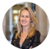
Constance Le Grip

Secrétaire du Sénat Membre de la commission de l'aménagement du territoire et du développement durable Membre de la délégation aux droits des femmes et à l'égalité des chances entre les hommes et les femmes